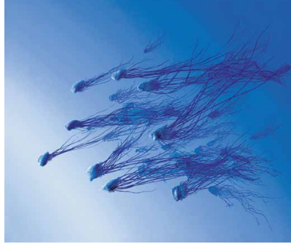
«Армия португальских корабликов», 2011.

исследованиями акул. Я сам буду часто бывать в музее, ведь Форт-Лодердейл – это город, в котором я живу.