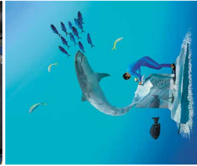
«Вырезая тигровую», 2011.