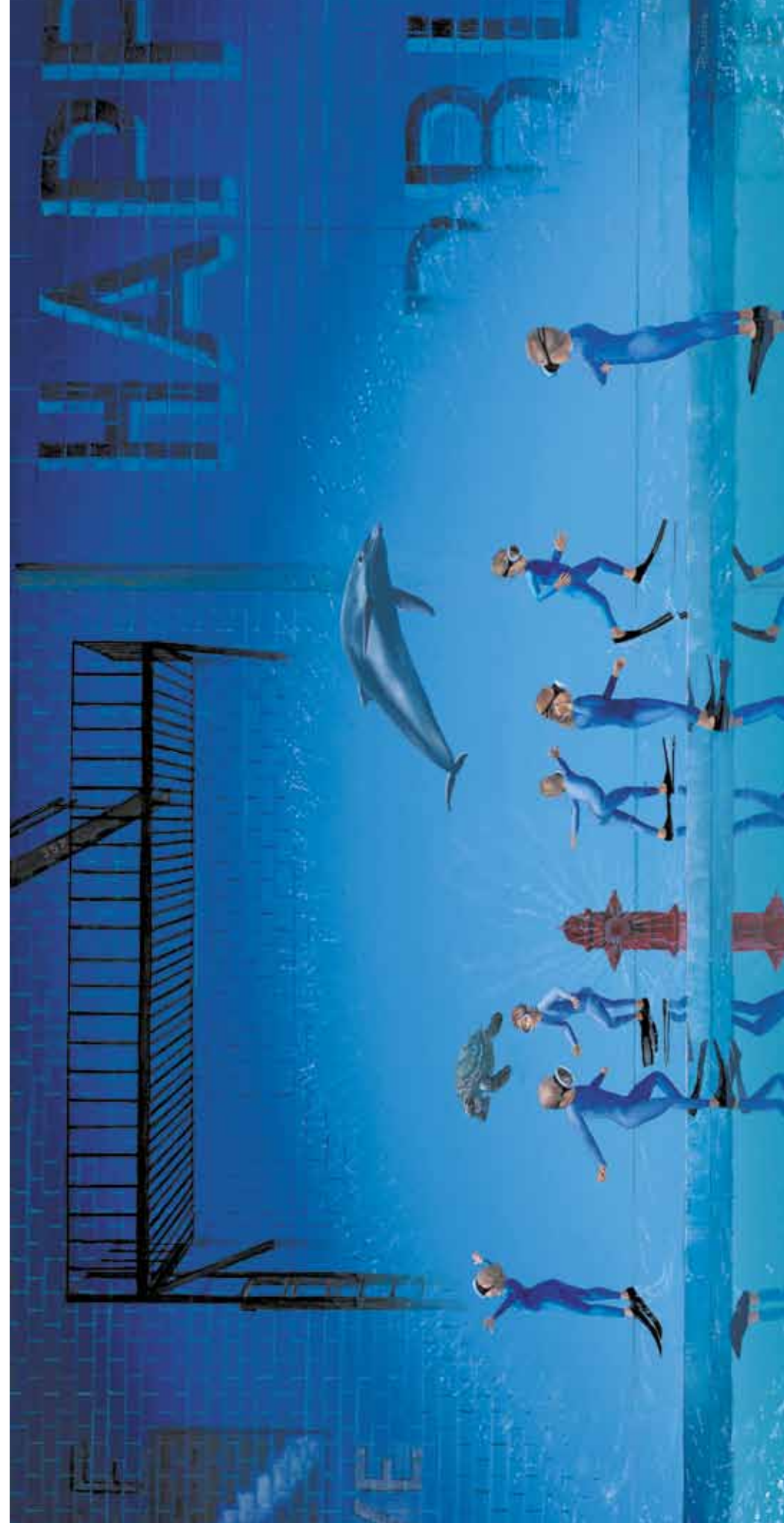
«Интриги пожарного гидранта», 2011.

InV: Столько за эти годы сделано и переосмыслено! Есть ли самые любимые картины? Меняется ли техника письма?