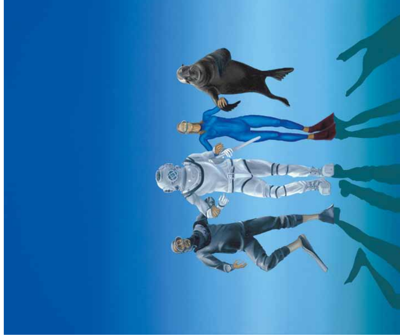
«Кусто, волшебник вод», 2010.