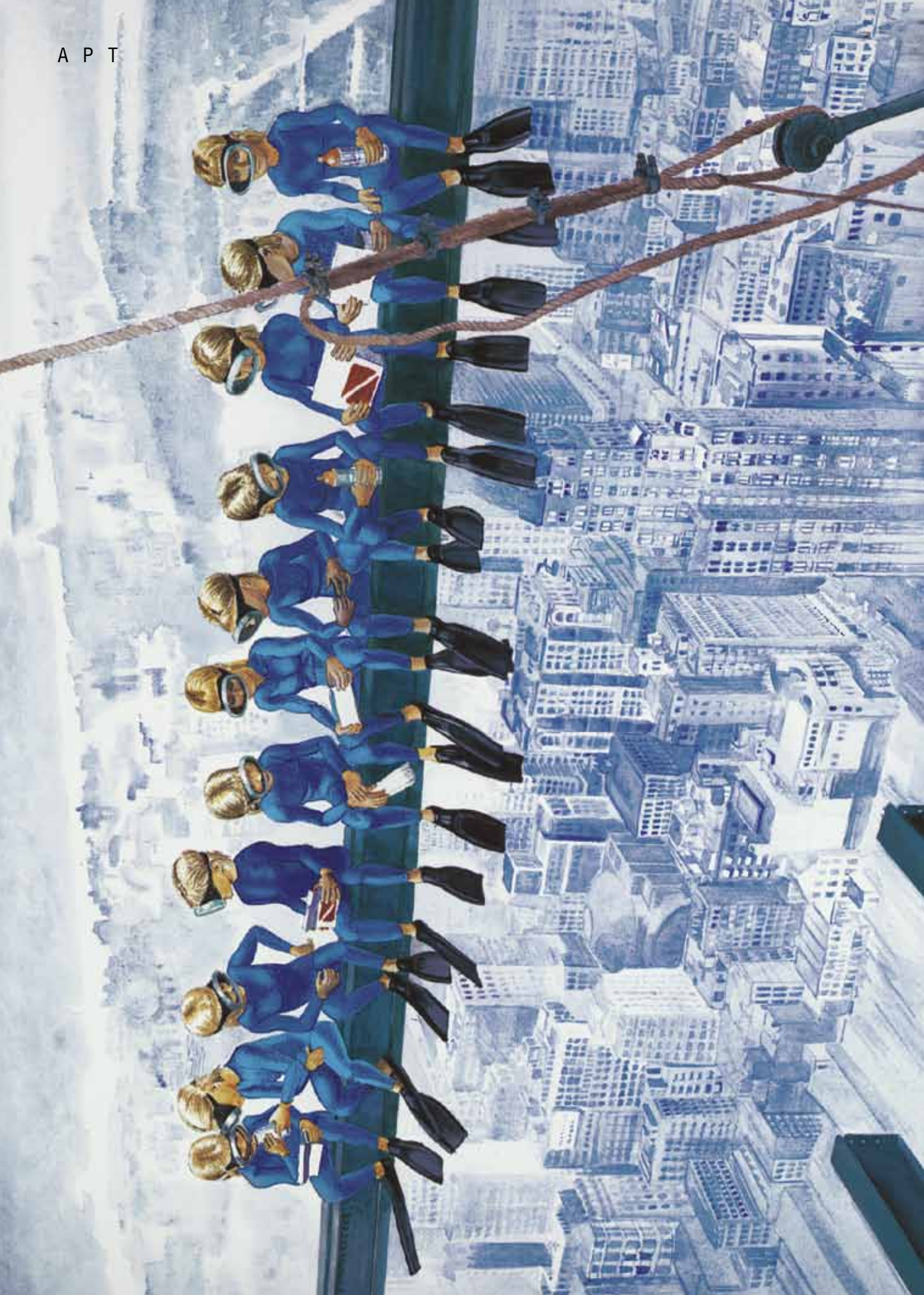
«Перекус на высоте». Рокфеллер-центр, 1932; 2005.